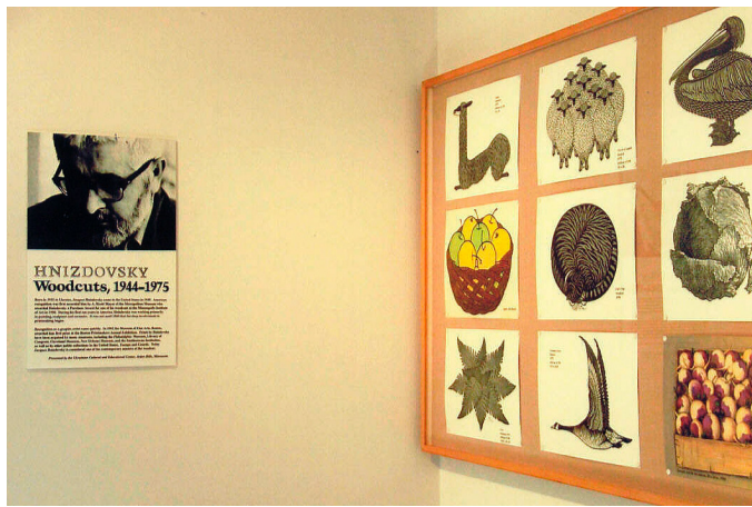
Фото виставка країнського художника графіка Якова Гніздовського.

Photo exhibit of Ukrainian graphic artist Jacques Hnizdovsky.