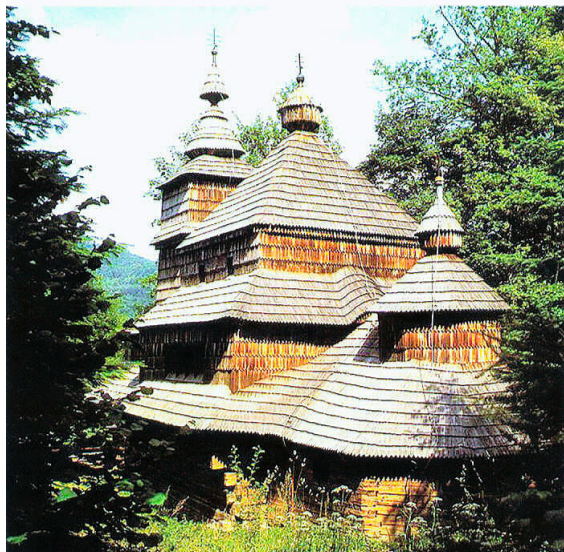
Українська дерев'яна Церква, як приклад давньої української архітектури. Ukrainian wooden church as an example of old Ukrainian architecture.