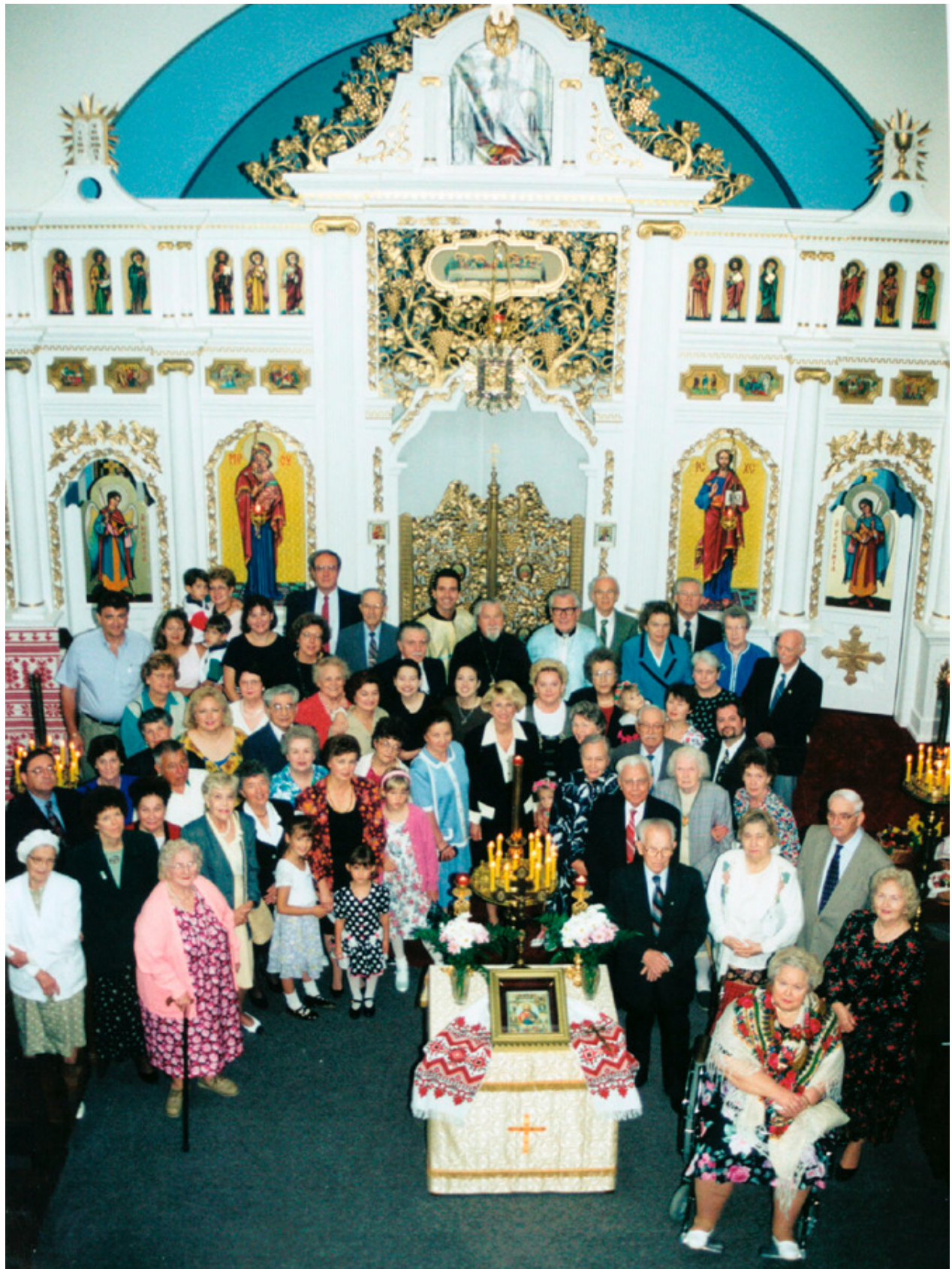
Parishioners and Friends in front of the Iconostasis of St. Katherine Ukrainian Orthodox Church in 1997. Парафіяни та друзі перед Іконостасом Української Православної Церкви Св. Катерини – 1997.