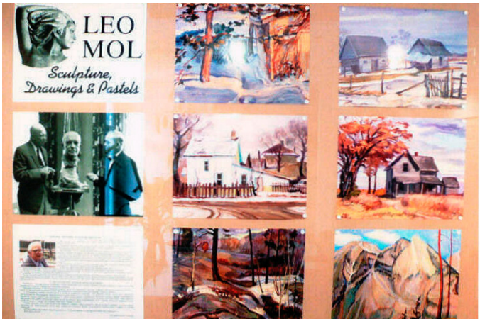
Фото виставка українського художника і скульптора Ліо Мола (Леоніда Молодожанина) Торонто, Канада.

Photo exhibit of Ukrainian artist and sculptor Leo Mol (Leonid Molodozhanyan), Toronto, Canada.