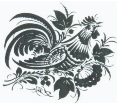
«Півник» - Андрій Пікуш Один з малюнків з виставки Андрія Пікуша з України в українському народному стилі «Петриківка». "Rooster" by Andrii Pikush One of the paintings from the Andrii Pikush (from Ukraine) exhibit in Ukrainian folk style "Petrykivka".

На загал, можна сказати, що Український Культурно-Освітній Центр в Арден Гіллс, Мінесота, дає місцевій громаді Сейнт Полу, Мінеаполісу та навколишніх місцевостей цікаві, інформативні виставки і відомості про Україну, українські традиції та про звичаї і таланти її народу.