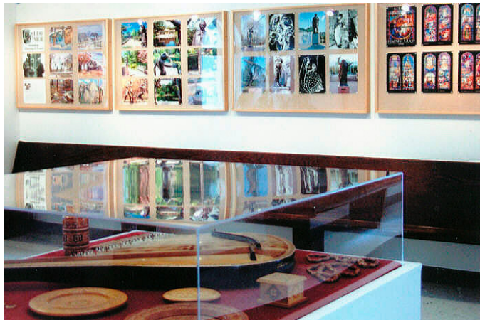
З-заду, на стіні, фото виставка українського художника і скульптора Ліо Мола з Торонто, Канада. З-переду виставка різьбярства та українського музичного інструменту бандури. On the wall in the background - Photo exhibit of Ukrainian artist and sculptor Leo Mol (Toronto, Canada). In front - exhibit of Ukrainian musical instrument bandura and samples of Ukrainian wood carved art work.

Throughout the years, Ukrainian Cultural Center participated in many cultural activities in the Twin Cities. It presented to the local community photos from the annual Festivals of Nations in Minnesota, the Ukrainian Heritage Fall Festivals, photos of artistic quality taken by various local Ukrainians during their travels in the United States, the Annual Ukrainian Festivals held in Dauphen,